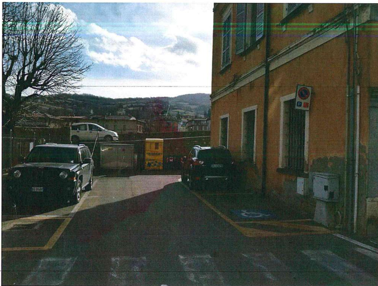
FOTO N. 1-Via S. Ambrogio manca un segnale di senso unico parallelo da installare sul lato ove è ubicato il segnale di sosta riservata ai veicoli al servizio delle persone invalide.